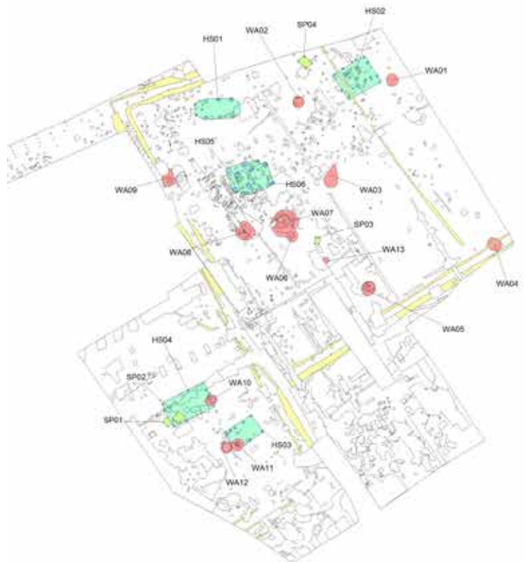
Voorlopige resultaten van de opgraving.

zeer verstoord om er ‘structuur in te ontdekken’. Het zuidelijk deel is minder verstoord. Daar is een tweede bewoningszone uit de Middeleeuwen aangetroffen. “Wel minder sporen