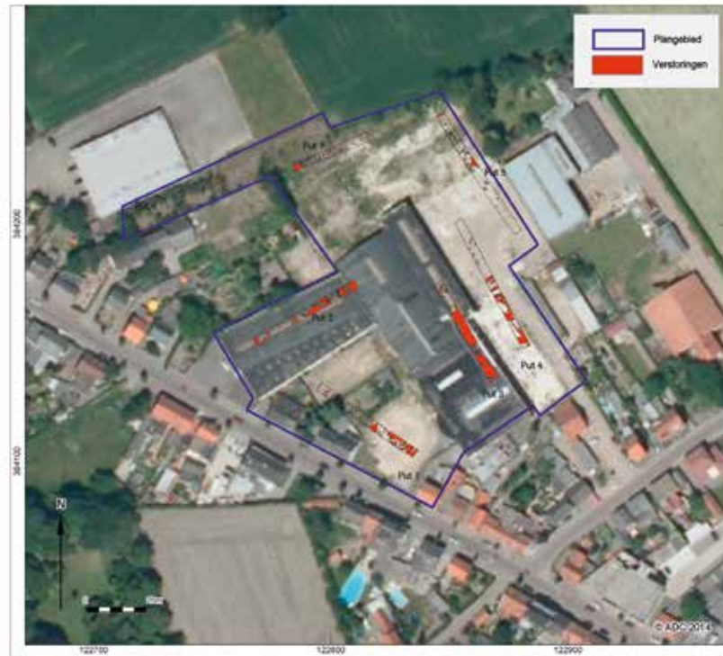
Luchtfoto van het Limfaterrein met de zeven proefsleuven. In rood de plaatsen waar de ondergrond is verstoord.

vaker tegen me gezegd: “Eigenlijk is het nog niet eens zo interessant hoeveel we vinden. Al is een archeologisch rijk gevulde bodem natuurlijk altijd leuk”, geeft hij eerlijk toe. “Neen, veel interessanter is te kijken naar verbanden, opgravingen in de omgeving, kijken of bestaande theorieën kloppen. Daarmee komt de archeologische wetenschap weer een stapje verder.”